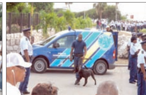
Momento cu polisnan a saca cachó pa enfrenta manifestantenan